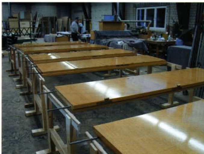
ANFERTIGUNG VON SPEZIAL-TÜREN

Die Schreinerei hat sich auf den Bau von Ladeneinrichtungen spezialisiert. So wurden etwa für die Mode-Kette »Louis Vuitton« bereits zahlreiche Geschäftseinrichtungen gebaut. Aber auch in der Düsseldorfer »Kö-Galerie« hat Jammer & Danzl etliche Nobel-Läden eingerichtet. Unter den weiteren Kunden sind namhafte Banken und Verlagshäuser. Gute Arbeit spricht sich rum: Nun sind auch Hausverwaltungen auf der Kundenliste. Für sie führt Jammer & Danzl Umbauarbeiten und Renovierungen durch. Ein eigener Kundendienst steht zudem für Kleinreparaturen zur Verfügung. Als „Visitenkarte“ im Spitzensport baute Jammer & Danzl die Geschäftszentrale der Düsseldorfer DEG Metrostars. Für sie gestaltete der Betrieb als Sponsor auch den VIP-Bereich.